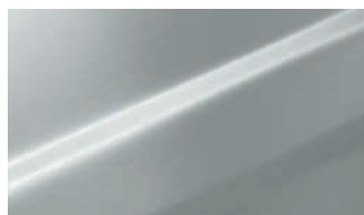
Silber natur E6/EV1 Eloxal, Detailelemente pulverbeschichtet RAL 9006