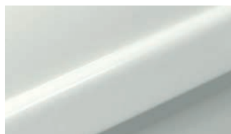
RAL 9016 (Verkehrsweiß) Pulverbeschichtung mit seidenglänzend glatter Oberfläche

Für die Gestellfarbe stehen hochwertige Pulverbeschichtungen und Silber natur zur Wahl: